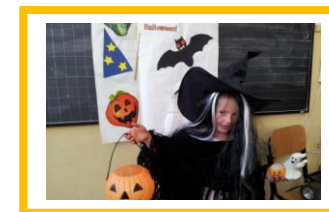
Halloween alla Mazzini