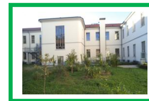
Il nostro orto

Nel cortile interno della scuola Mazzini è situato un orto didattico, in continuo allestimento, dove gli alunni hanno la possibilità di piantumare ed osservare dal vivo la crescita di piante aromatiche, verdure e alberi da frutto.