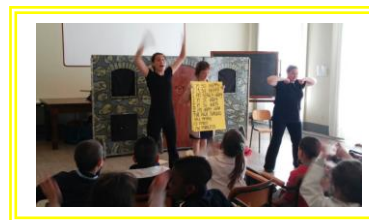
Spettacolo interattivo d'inglese